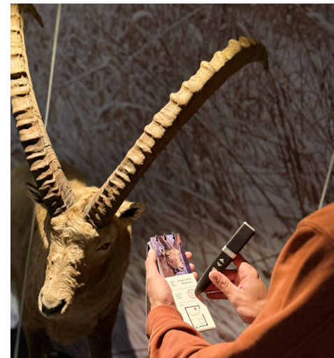
↑ Balade entre chien et loup , un parcours audio du Musée de la nature du Valais

Auch das 2019 gestartete Sammlungsinventar-Projekt wurde erfolgreich abgeschlossen. Sämtliche kantonalen Bestände wurden überprüft. Diese Objekt-für-Objekt-Inventarisierung umfasste die Zustandskontrolle, präventive Konservierungsmassnahmen, die Ergänzung des Inventars, die Überprüfung administrativer Daten sowie die Aktualisierung der fotografischen Dokumentation. Damit sind die Sammlungen bereit für den Umzug in das zukünftige neue zentralisierte Depot.