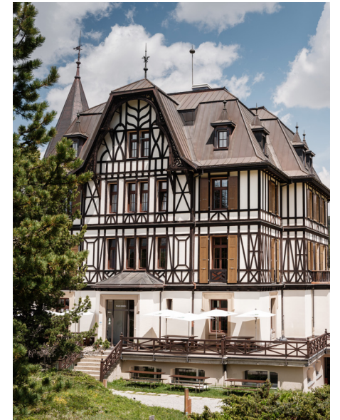
1_World Nature Forum, Naters 2_Centre culturel de la Vidondée, Riddes