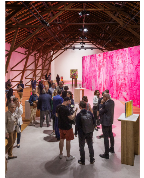
1_Château de Saint-Maurice 2_Espace d'exposition de la collection communale, Savièse