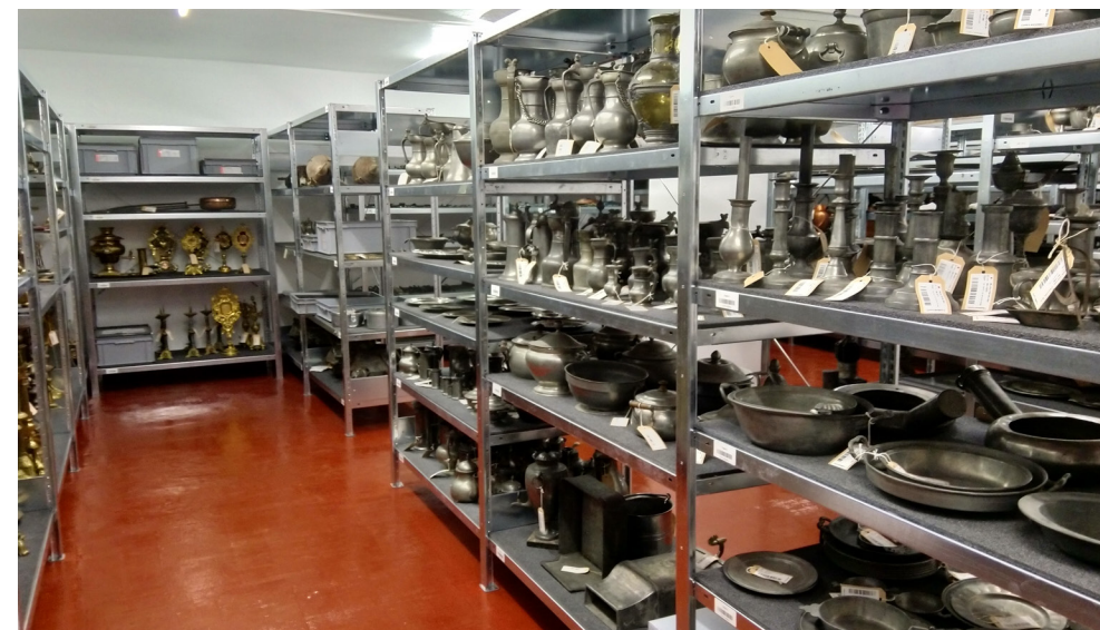
↓ Chantier des collections, réserve de la collection métal après récolement et avant déménagement.