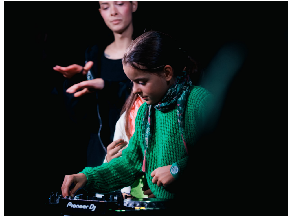
← ↑ Nuit des Musées 2025