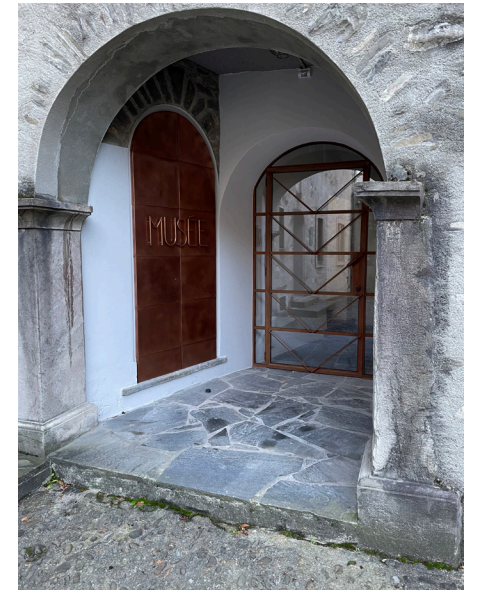
1_Musée de Fully. Eau de lumière 2_Musée le Grand-Lens 3_Musée d'Isérables