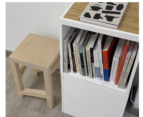
↑ ExpoNomade, Immigrer au fil des âges © AVM / VWM, photo: Alexis Feuillet ← Affiche de l'exposition © AVM / VWM, graphisme: Léa Hunziker