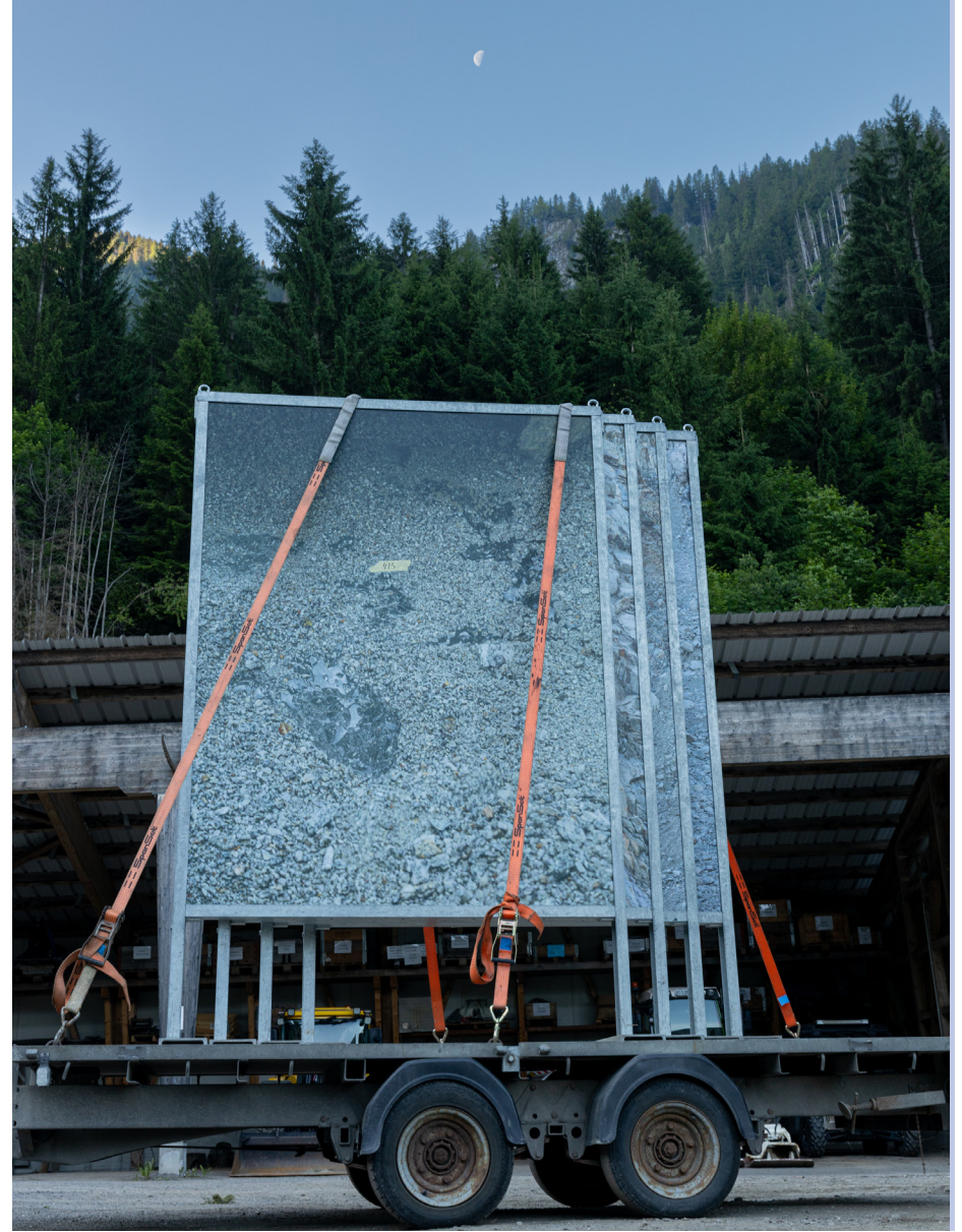
1_Musée valaisan des Bisses. Journée internationale d'irrigation traditionnelle, 2025 2_Musée de Bagnes. bagnoles altitudes , 2024