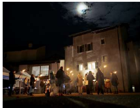
Nuit des Musées 2022, tour Lombarda, St-Séverin.

En ce qui concerne les événements ponctuels, le programme varié et convivial de la Nuit des Musées du 5 novembre 2022 a attiré de nombreux curieux et proposé de belles découvertes qui ont ravi les visiteurs: animations pour les enfants, contes, spectacles de feu en extérieur et visite aux flambeaux du nouveau sentier historique « Le Bourg de Conthey vers 1470 » par l'Association des Amis du Patrimoine. A noter que la visite de l'espace « Autour de la Forge » faisait également partie du programme de la journée d'accueil des nouveaux arrivants de la commune de Conthey, le 28 août 2022.