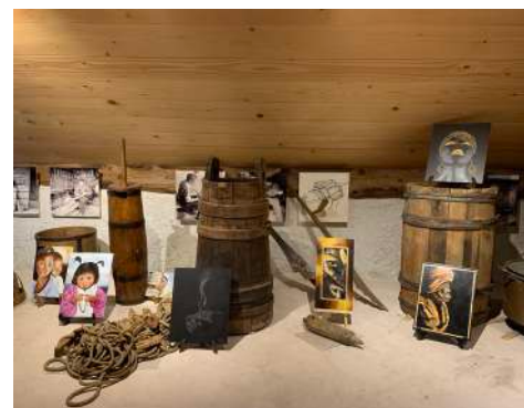
Exposition de Marylou Fumeaux.

En coulisses, une réflexion pour la création d'un niveau de lecture enfant de l'exposition permanente a été initiée avec le bureau Anadéo.