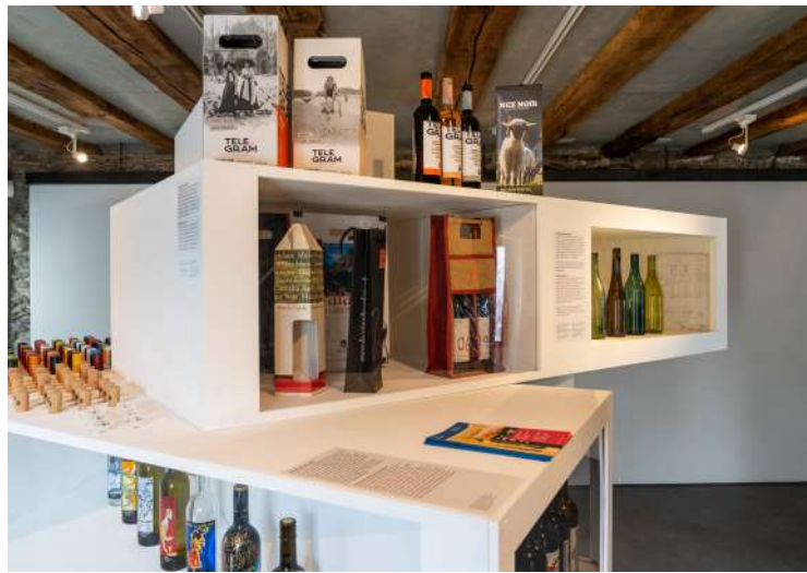
Musée du Vin, Exposition Le grand théâtre du vin – In costume, taillé sur mesure