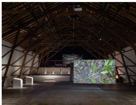
Ferme-Asile. Exposition de Manon Bellet.

En 2022, la Ferme-Asile a accueilli près de 8000 visiteurs pour son programme artistique et culturel.