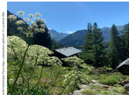
Jardin botanique Flore-Alpe, Cosopitium golicum .

Les Jardiniers de Flore-Alpe ont effectué un important travail de mise en valeur des collections grâce à de nouvelles étiquettes et ont réalisé de nombreuses plantations, notamment plusieurs châtaigniers. La conservation ex situ du Carpesium penché , espèce en danger, réalisée pour le Canton du Valais, a été poursuivie avec succès.