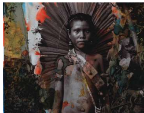
Exposition Daniel Schweizer - Une Odyssée amazonienne.

Parallel zu den Vorbereitungen für die einmaligen Events laufen die administrativen und kuratorischen Arbeiten weiter. Ein grosser Rutsch von noch nicht erfassten Objekten konnten inventarisiert werden.