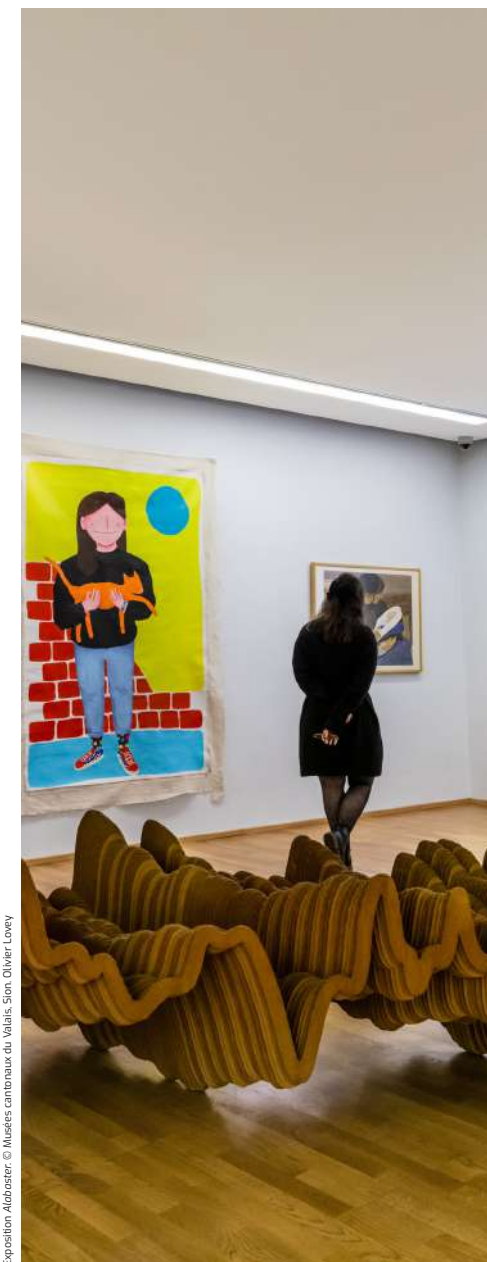
Exposition Alabaster.