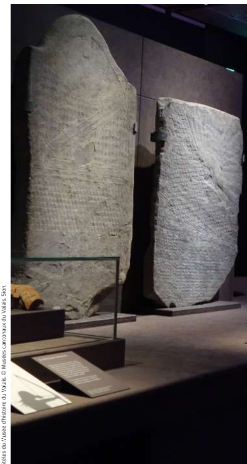
Stèles du Musée d'histoire du Valais

den Sammlungen der Institutionen der Dienststelle für Kultur. So sind fast 20'000 Objekte des Geschichtsmuseums online verfügbar, mit einem Bild und einer Kurzbeschreibung, zum Teil begleitet von einer ausführlicheren Notiz, die teilweise ins Deutsche oder Englische übersetzt ist. Da die meisten Objekte in einem Lagerraum aufbewahrt werden, bietet diese Datenbank der Öffentlichkeit und den Forschern einen virtuellen Zugang.