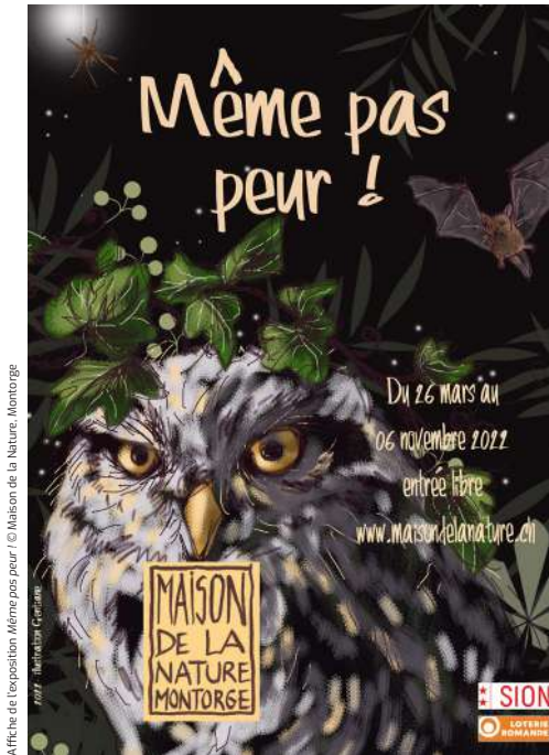
Affiche de l'exposition Même pas peur!

Comme nouveauté pour 2022, on peut relever la tenue d'un stand aux festivals Hérissons sous gazon et à Festi'Bagnes où la Maison de la Nature a pu faire connaître ses activités.