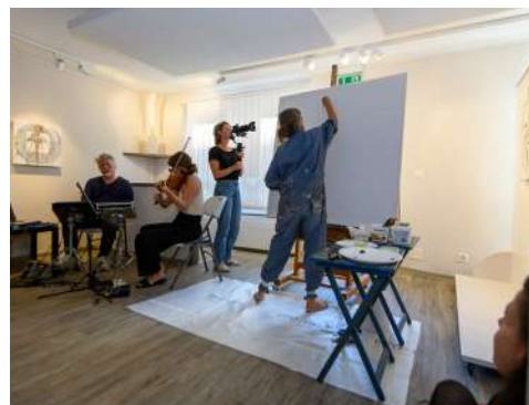
Chantal Moret Valimages, 2022. © Nind'Art

Venus en nombre cette année encore, vous êtes plus de 2'000 personnes à nous avoir rendu visite. Ce joli succès nous encourage à poursuivre notre travail en 2023.