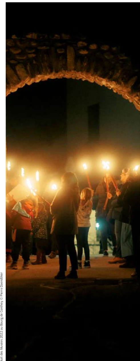
Nuit des Musées 2022 au Bourg de Contthey