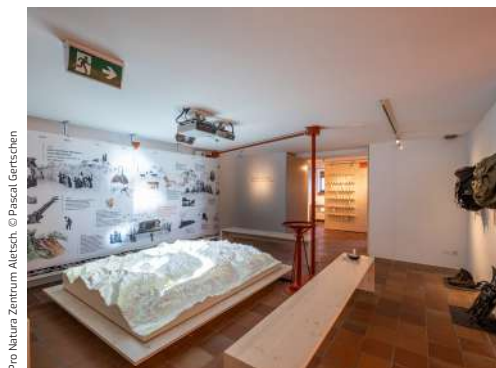
Pro Natura Zentrum Aletsch.

Auch der Pensionsbetrieb gab Anlass zur Freude. Nach zwei Sommern mit eingeschränkter Kapazität konnte wieder mit einem Normalbetrieb gefahren werden und die Anzahl der Übernachtungen stieg mit über 5'000 auf ein Vor-Corona-Niveau an.