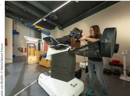
«Abheben für die Biodiversität» konnten die Besucher mit auf dem Flugsimulator von Birdlife.

Viel Abwechslung boten die verschiedenen Wechselausstellungen im Obergeschoss des WNF: Die Sonderausstellung Erlebnis Wiesenbrüter war von März bis September zu Gast in Naters. Nach der Präsentation der Siegbilder des Fotowettbewerbs Faszinierende Vogelwelt gab es im November auf dem Flugsimulator von Birdlife unter dem Motto Abheben für die Biodiversität Gelegenheit, die Welt aus Insektenperspektive zu erleben. Seit Dezember können die Besuchenden schliesslich den Spuren aus dem Eis folgen und sich über die Gletscherarchäologie informieren.