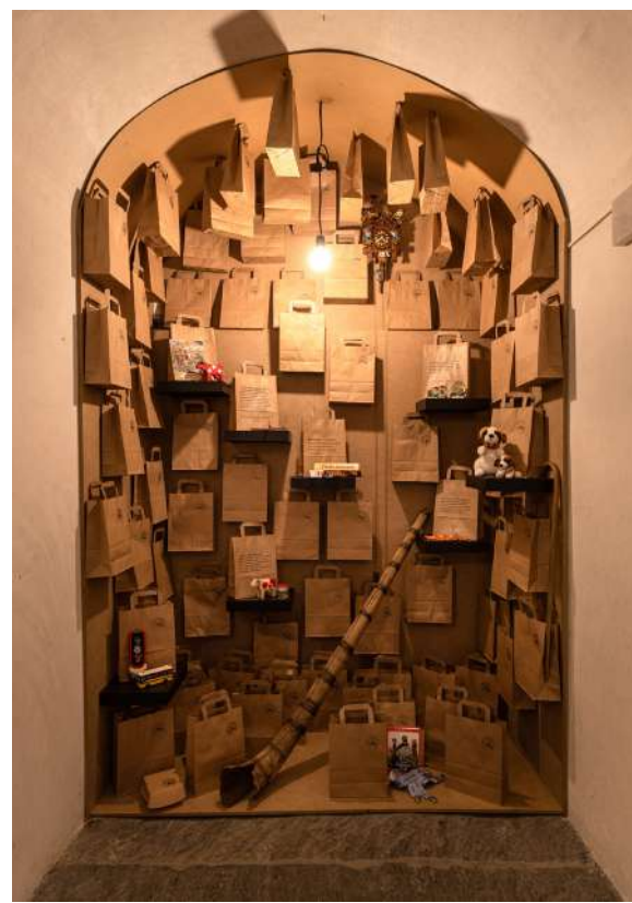
Musée de Bagnes, Exposition Label Montagnard