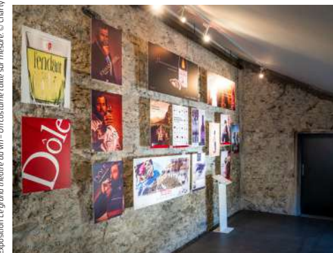
Exposition Le grand théâtre du vin – Un costume taillé sur mesure, © Charly Cavin

Verschiedene Veranstaltungen haben das Jahr geprägt, darunter ein Gespräch mit einem Etikettensammler, ein Vortrag über die Geschichte des Weinplakats und Aktivitäten für Kinder. Es wurden auch zahlreiche Führungen durchgeführt – darunter Blitzführungen während der Offenen Weinkeller und eine Führung des Sammlungsdepots – sowohl durch die Wechselausstellung in Siders als auch durch die Dauerausstellung in Salgesch oder auf dem Rebweg, der die beiden Museumsstandorte verbindet.