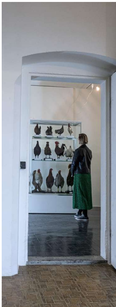
Exposition Artificiel

Enfin, l'année a été marquée par l'approbation de la nouvelle définition du musée de l'ICOM international. Le Musée de la nature du Valais y a été très étroitement associé, car son directeur fait partie des vingt membres constituant le groupe ICOM Define chargé d'élaborer cette nouvelle proposition de définition.