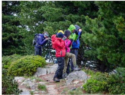
Wildbeobachtung, 2022