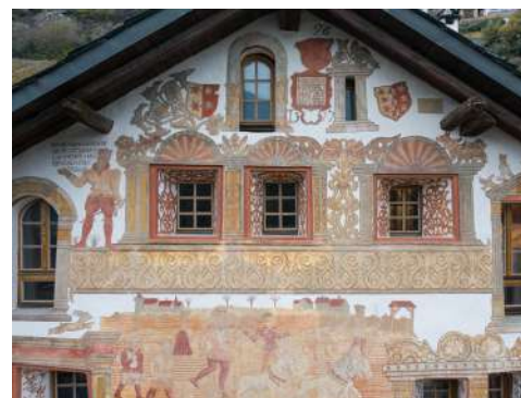
Château de Vaas, 2022

L'équipe du Château de Vaas – Maison des cornalins a également travaillé en 2022 sur la future exposition temporaire dédiée aux étiquettes de cornalin, intitulée Regarde-moi ! J'habille le cornalin , qui sera présentée du 01.09 au 31.12.2023.