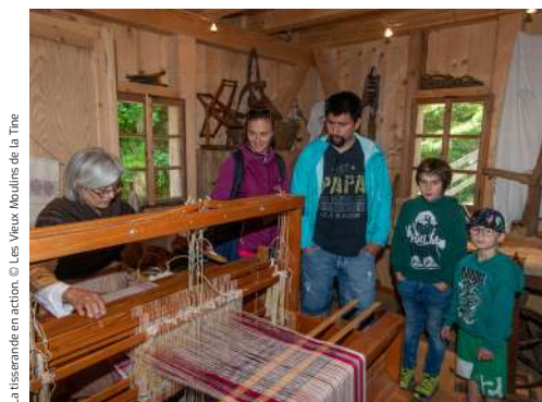
La tisserande en action.