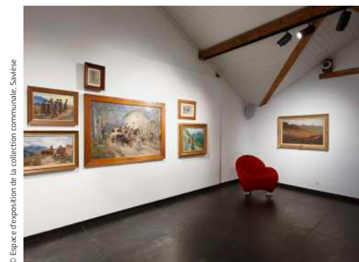
© Espace d'exposition de la collection communale, Savièse

La fréquentation des expositions continue d'augmenter. La professionnalisation des outils de promotion et de diffusion participe notamment à une reconnaissance plus large du lieu. La couverture médiatique s'étoffe progressivement (Rhône FM, Le Nouvelliste, etc.) et les expositions sont parallèlement promues à l'échelle régionale (Accrochages) et nationale (Kunstbulletin).