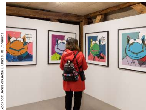
Exposition: Drôles de chats

Malgré la succession de canicules ayant traversé l'été, elle a accueilli 14'010 visiteurs venus de toute la Suisse romande, comme de France, d'Italie et de Belgique. Cette fréquentation la place, après les expositions Petzi, (22'730 visiteurs, en 2018) et Mordillo (16'400 visiteurs, en 2013), en troisième place des objets les plus fréquentés du château.