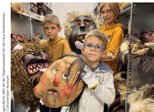
Agenda: Hilfe bei der Objektauswahl für die neue Maskenschau.

Der vollständige Jahresbericht 2022 des Lötschentaler Museums ist einsehbar auf www.loetschentalemuseum.ch .