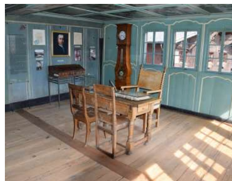
Museum Jost Sigristen Amtsstube

Die Stiftung und der Verein Heimatmuseum und Kulturpflege in Ernen wollen gemäss Stiftungszweck und Vereinsstatuten zum Erhalt der Kulturlandschaft und der Dorfbilder in der Gemeinde Ernen beitragen. Die Pfarrei Ernen plante beim Parkplatz beim Dorfeingang ein Absturzgitter, dunkelgrau gestrichen und deshalb auffällig. Absturzgitter sind wohl nötig, sollen jedoch möglichst diskret aussehen. Nach einer Einsprache, mehreren Diskussionen und Ortsschauen einigten wir uns mit der Bauherrin, dass das Absturzgitter aus verzinktem Stahl gebaut wird und zogen unsere Einsprache zurück.