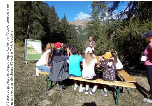
© Centre de géologie et de glaciologie. Atelier sur l'écosystème des montagnes avec la garde-chasse, d'Éveline M.-H. Fauchère