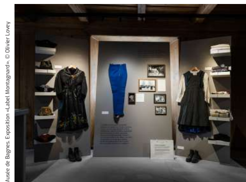
Musée de Bagnes, Exposition «Label Montagnard».