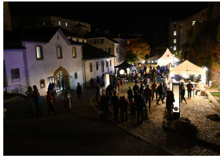
Nuit des Musées 2022