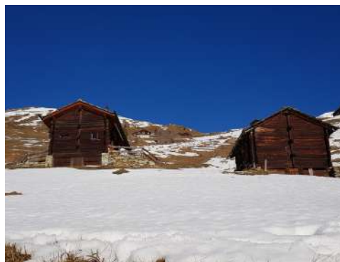
Grange traditionnelle et transformée

Enfin, dans le sillage de cette exposition annuelle, la Fondation s'est engagée dans la voie de la restauration d'un grenier daté de 1613 et dont les travaux devraient s'achever en 2023, avec la publication d'un nouveau cahier dans la série Mémoire d'Evolène .