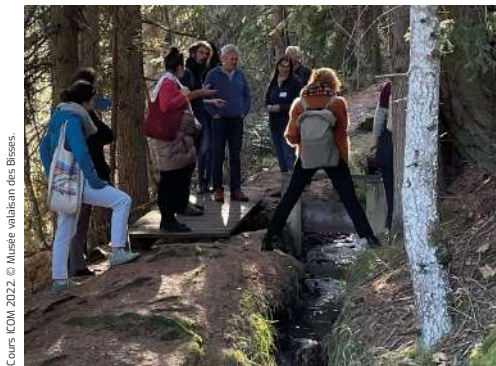
Cours ICOM 2022.

Un grand merci à toutes et tous et rendez-vous le 22 avril pour notre saison 2023.