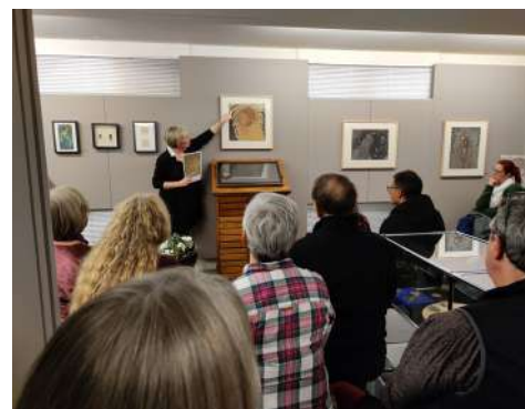
Nuit des Musées 2022.

Lors de la Nuit des Musées, autour de l'exposition Art nouveau , le musée a invité trois fleuristes à créer une composition florale en lien avec une œuvre d'Olsommer. Le jour J, chacune a présenté sa création, suivie d'un commentaire d'œuvre par la conservatrice du musée. Un atelier de création de photophores en fleurs pressées a été proposé aux enfants. La soirée s'est poursuivie par un vin chaud au son de la cornemuse sur l'esplanade du musée.