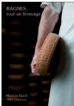
Flyer de l'exposition consacrée aux objets de l'industrie laitière

Le Musée de Bagnes, au Châble, a accueilli 4 expositions temporaires en 2009, dont 3 consacrées à des artistes : Walter Mafli, Quinte de tout, Visages et La Dranse, habiter la vallée .